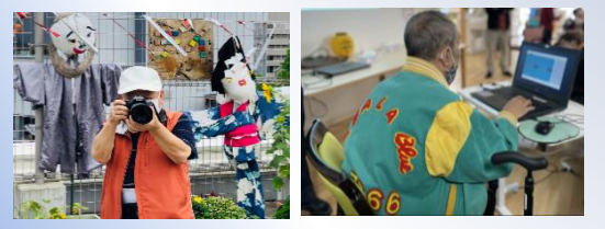
作成者：池田様↑ 作成者：山田様↑